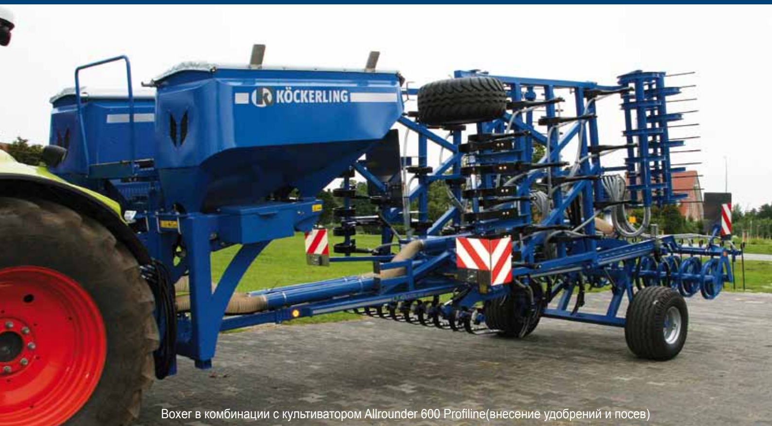
Вохер в комбинации с культиватором Allrounder 600 Profiline(внесение удобрений и посев)